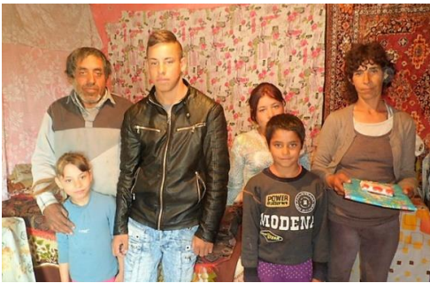
Uw cadeau wordt persoonlijk overhandigd, maar direct uitpakken vinden zij niet beleefd

Vandaag bezochten we Fiscut, dit was met niets te vergelijken: modderige wegen, enorme kuilen in de weg, loslopende paarden en honden en plots overstekende koeien. De huizen waren hutjes, meer kan ik er echt niet van maken.